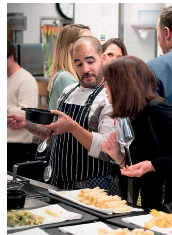
Un coup d'œil dans les coulisses de la cuisine de l'hôtel.