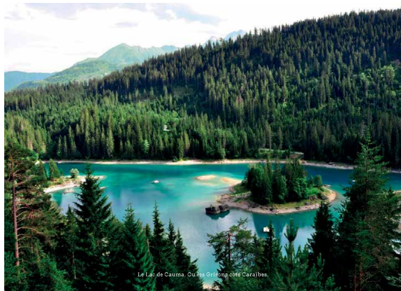
Le Lac de Cauma. Ou les Grisons côté Caraïbes.

Le Waldhaus Flims Alpine Grand Hotel & Spa écrit l'histoire depuis 140 ans déjà. Même le «Grand Opening» qui eut lieu au printemps de cette année sera raconté dans les livres d'histoire. J'ai eu la chance, en compagnie de plus de 300 invités, de pouvoir vivre cette fête. Voici donc trois journées que je n'oublierai pas de sitôt. Après presque deux heures et demi de route depuis Zurich, j'avancai la Maserati Levante qui avait été mise à ma disposition devant le Grand Hotel datant de la «Belle Époque», où je fus accueilli par une bande de photographes et par le personnel très sympathique de l'hôtel.