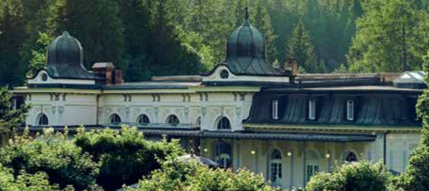
Architecture et nature en harmonie.